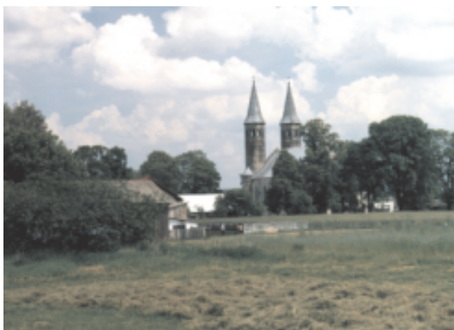
Kościół parafialny w Miedzierzy